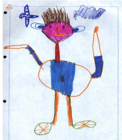
Das Kind hat einen Körper bekommen (durch Klang erspürt)

Obwohl dieses Kind, wie im rechten Bild ersichtlich, bereits einen Körper bekommen hat, fehlen immer noch die Finger für die Feinmotorik. Somit wäre zu diesem Zeitpunkt ein Klavierspiel kaum möglich!